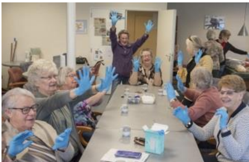
Lentelunch - al "Corona" voorbereid.